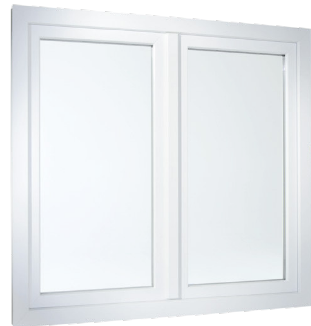
2-flügeliges Fenster in flächenversetzter Variante